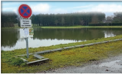
Point d'eau naturel